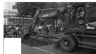
Antwerpen ontregeld door waterlek