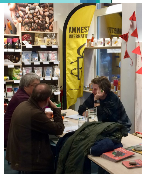
Zonnestad 'op tournee' - wereldwinkel

'In oktober waren er enkele adviesmomenten in De Punt in Gentbrugge. We mikten er op de particulieren die er werken, maar ook het betrekken van de buurtbewoners verliep goed. We kijken nog naar verdere mogelijkheden uit die contacten. Misschien kunnen we adviesmomenten organiseren in de bedrijven zelf of zijn bedrijven geïnteresseerd om zonnepanelen te plaatsen via derdepartijfinanciering door Energent... In november zitten we in het café-restaurant ENTR van De Centrale en nog twee woensdagen in Vooruit. De data worden steeds via de website bekend gemaakt.'